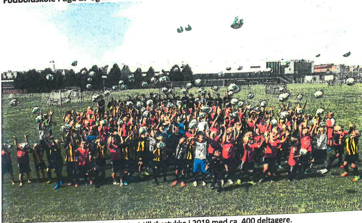
Fodboldskole og camps blev et stort tilløbsstykke i 2019 med ca. 400 deltagere.